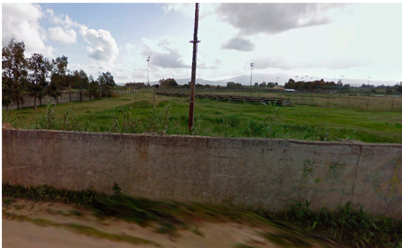
Vista panoramica zone d'intervento